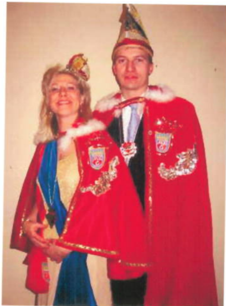
Claus I. / Astrid I.