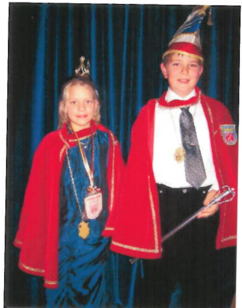
Wilhelm I. / Taina I.