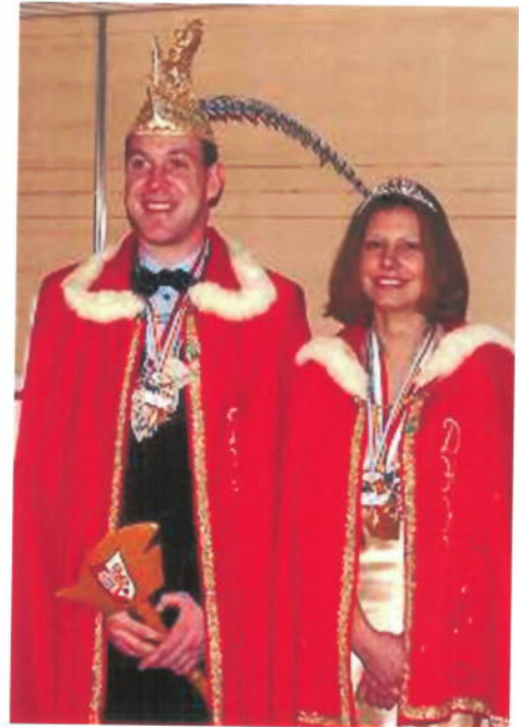
Ralf I. / Svenja I. Dithmarscher Heimat- Und Karnevalverein