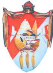
Komitee Kieler Karneval