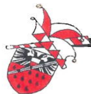
Lübeck- Rangenberger KCl